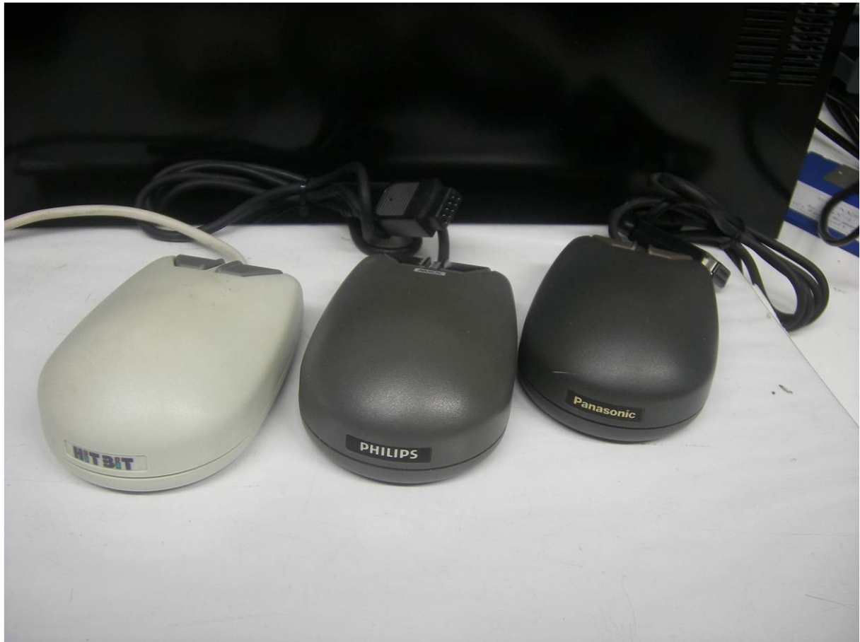
Sony MOS-1, Philips SBC 3810, Panasonic FS-JM1

Regelmatig komt het voor dat de muis niet meer werkt. In de meeste gevallen is het schoonmaken van de geleidewieltjes de oplossing. Maar een kabelbreuk komt ook regelmatig voor, echter de originele kabels zijn niet meer te verkrijgen. In plaats van de originele kabel kun je ook een joystick-kabel nemen met 9 aders. Neem bijvoorbeeld een oude Quickshot, Crackshot of Spectravideo-Joystick en kijk eerst of deze goed werkt. Haal deze kabel voorzichtig uit de Joystick. De “nieuwe” kabel is niet voorzien van juiste connector, maar kan eenvoudig gesoldeerd worden op de pinnen van de muis-connector.