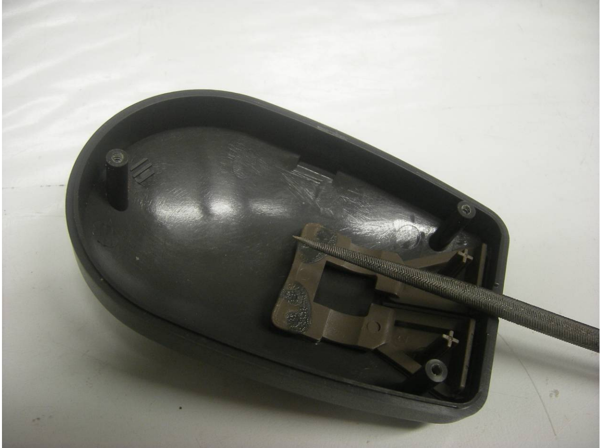
De behuizing aanpassen voor de "nieuwe" kabel